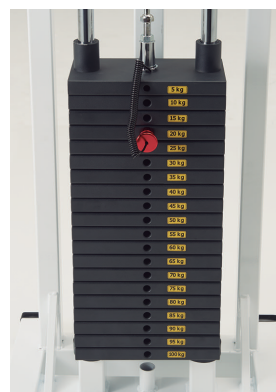
(スチール重りタイプ)