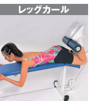
12 / 大腿二頭筋