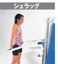
1 / 僧帽筋