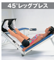
10 / 大腿筋 11 / 大腿四頭筋 13 / ハムストリング