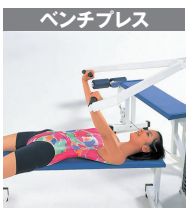
4 / 上腕三頭筋 5 / 三角筋 6 / 大胸筋