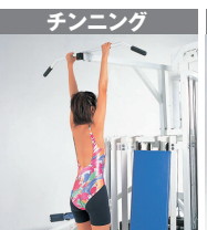
3 / 上腕二頭筋 9 / 広背筋 14 / 大円筋