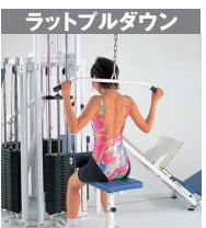
2 / 上腕筋 3 / 上腕二頭筋 9 / 広背筋