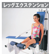
11 / 大腿四頭筋